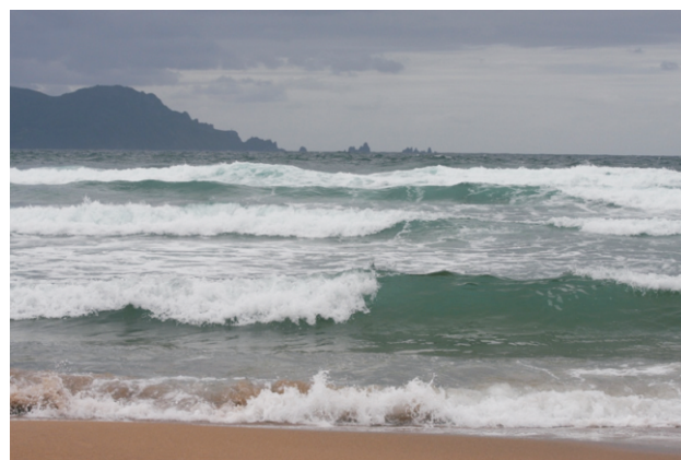
Praia de Esteiro e Cabo Ortegal.