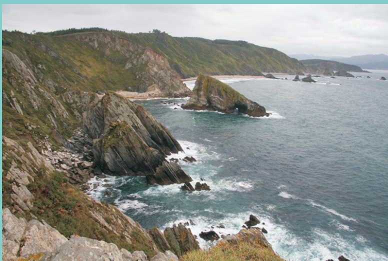
Cantís do Picón e Pena Furada.

Unha ruta para gozar dos contrastes e das formas creadas pola forza do mar, á vez que dunha espectacular paisaxe da costa norte na ría de Ortigueira.