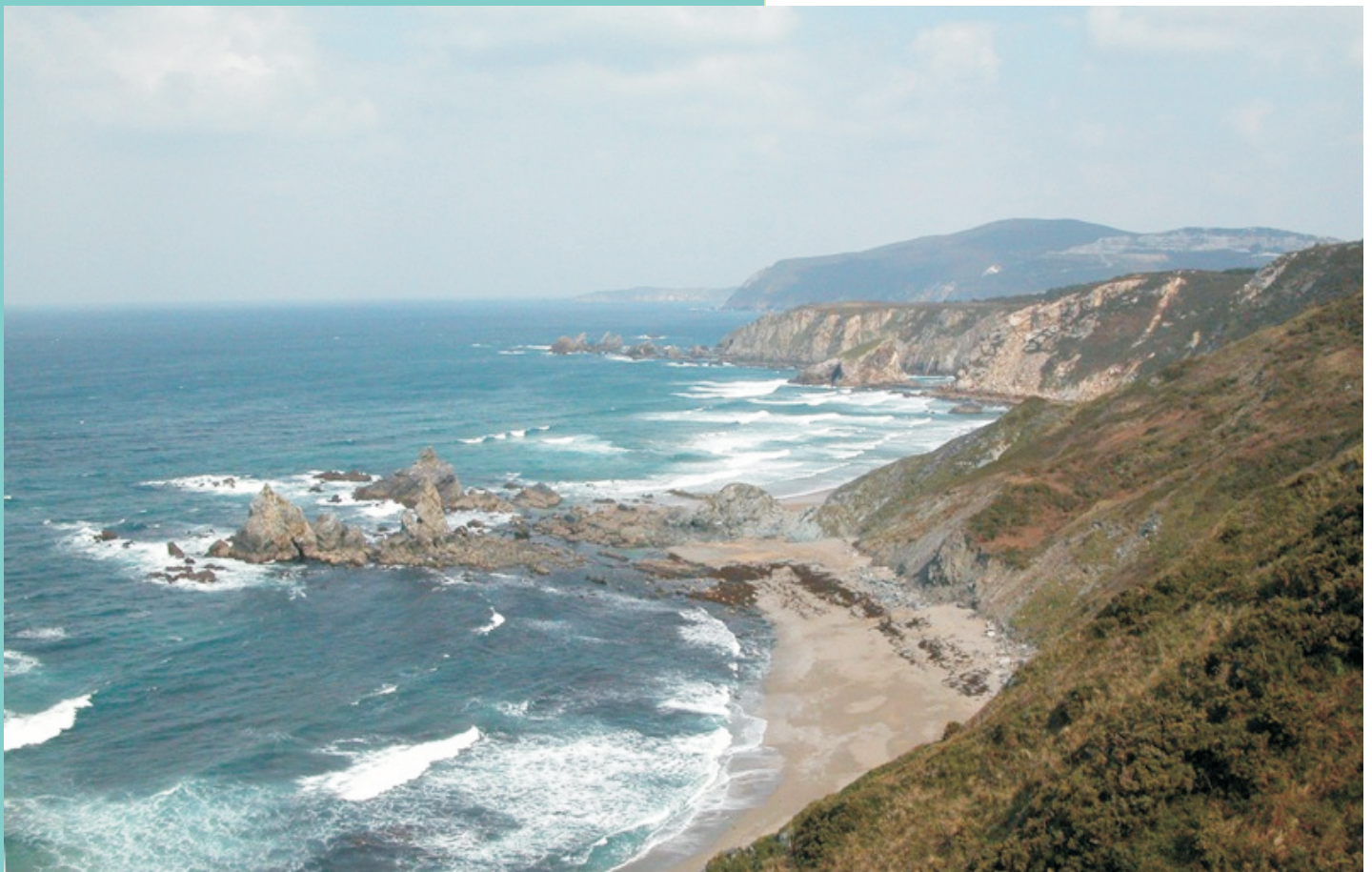
ntís do Picón e Os Coitelos